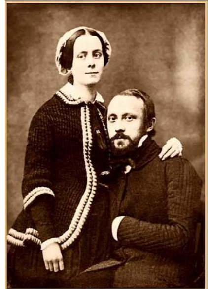
30-jährige Rudolf Virchow und seine etwa 19-jährige Ehefrau Rose (geb. Mayer) im Jahre 1851 während der Würzburger Zeit, die zweite Fotografie zeigt ein Porträt des älteren und nun schon weltbekannten Berliner Pathologen.

1855 veröffentlichte er in seinem Archiv einen Aufsatz mit dem Titel Cellular-Pathologie , in dem er die Umrisse eines neuartigen Forschungsparadigmas für die Medizin skizzierte: „Rücken wir bis