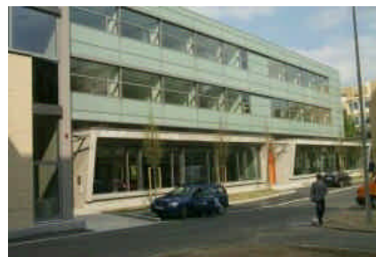
Südseite - Lesebereiche im EG; Eingangsseite

unangenehme Diskussion mit einem Bibliothekseinrichter vor einem großen Gremium, bei der ich unmissverständlich darauf aufmerksam machen musste, dass die Bibliothek die Kundin ist und erwartet, dass der Anbieter ihre Wünsche erfüllt statt seine verwirklichen zu wollen - nach all diesen Schwierigkeiten also erwarteten wir für den Umzug die absolute Stresssituation, die uns auf jeden Fall den Rest geben würde.