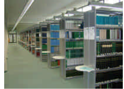
Freihandbereich geb. Zeitschriften

Monographien vor '45, die wir eigentlich weder brauchen noch haben wollen, wurden in den Keller verbannt, weil sie aus mehr oder weniger bibliophilen Gründen nicht einfach ausgesondert werden sollen.