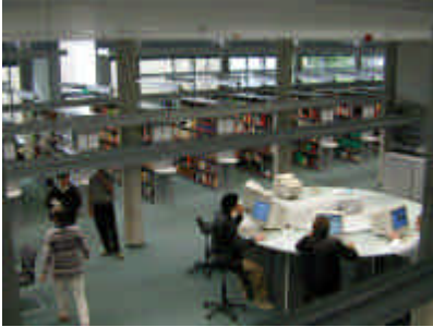
Blick von der Galerie

Und so befinden - und befinden - wir uns in einem Dauerspagnet zwischen Anspruch und Wirklichkeit. Ein seit Jahren vertrauter Zustand im Grunde, aber für den Neubau eigentlich nicht mehr vorgesehen.