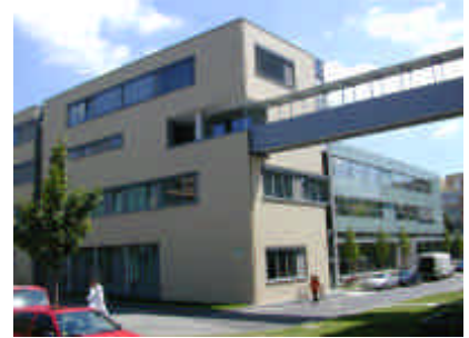
Ostansicht - Dienstzimmer im EG

die Anforderungen an jeden einzelnen deutlich gestiegen sind. - Unerträglich leicht wird es deswegen nie werden.